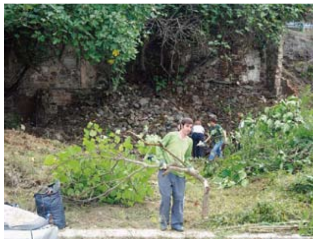
Figura 1. Grup de voluntaris netejant les ruïnes del molí de Lloberons