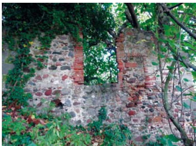
Figura 3. Paret lateral del molí de Lloberons