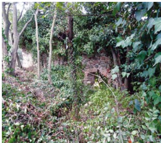
Figura 10. Façana del Molí

Pot observar-se encara l'existència d'un segon rec, a sota del rec de Dalt, que recollia l'aigua que evacuaven el safareig de can Fenosa i el molí de Lloberons. Aquestes aigües s'incorporaven a les del rec de Dalt allà on el desnivell entre els dos recs s'anul·lava.