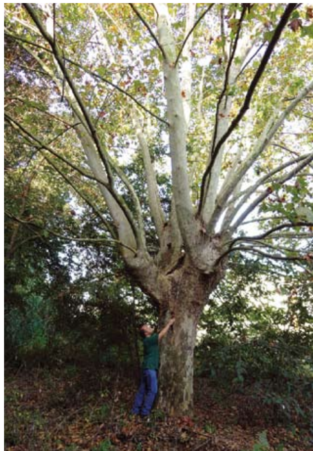
Figura 16. No hi manquen els plataners

A part de conservar-ne la memòria, el complex descrit es pot adaptar fàcilment a un itinerari de natura que segueixi el rec Gran, tant pel seu al·licient històric com paisatgístic.