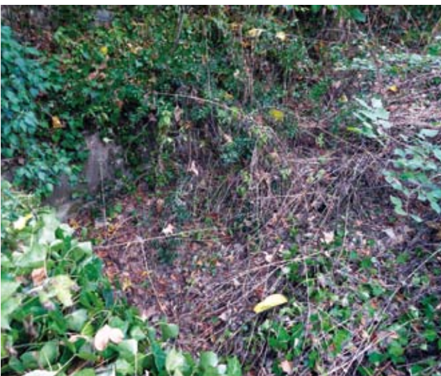
Figura 9. La bassa que alimentava el molí

mensions considerables, que emmagatzemava l'aigua per fer funcionar el molí. Un cop plena la bassa, en sobreeixir, l'aigua del rec seguia el seu itinerari, ara al descobert.