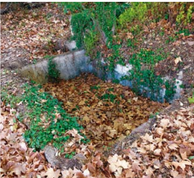
Figura 15. El safareig de can Fenosa situat a la part de sota d'aquesta masia

Cal destacar l'existència d'una flora exuberant a prop del rec i en tota la seva llargada, amb arbres gegants, alguns dels quals mereixerien ser catalogats com a arbres monumentals.