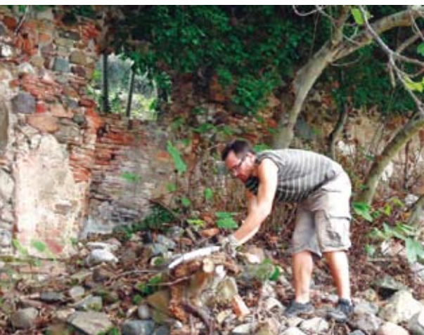
Figura 2. Paret interior del molí de Lloberons paral·lela a la carretera de la Roca