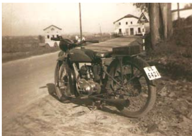
Figura 4. Anys 1940. L'edifici de l'esquerra és el desaparegut molí de Carrencà.

Un pergamí de l'any 1153 parla d'un lloc anomenat Carrencà, situat a la zona alta del riu Besòs, on els templaris tenien un molí treballat, juntament amb les terres adjacents, per Petrus Raimundi. Segons un pergamí dipositat a la Cartoixa de Montalegre, l'any 1196 hi va haver un plet sobre el dret de regar amb l'aigua que passava per Carrencà. Tenim notícies d'un molí a Carrencà (1884) i sabem de l'existència d'un edifici que havia fet de molí enderrocat definitivament quan es va construir el Polígon Industrial de Can Roca els anys cinquanta.