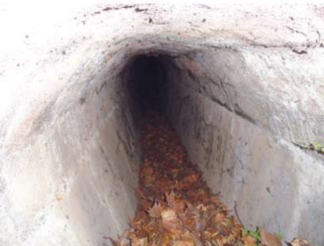
Figura 5. Part en que el rec anava canalitzat