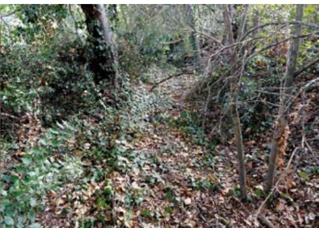
Figura 6. Part on el rec anava superficial

La fertilitat i el rec d'aquestes terres amb l'aigua abundant del riu Besòs i de les deus de la Serralada Litoral, va fer que molt aviat apareguessin masies riques com can Buscarons a Montornès i Carrencà, can Fenosa i can Puig a Martorelles.