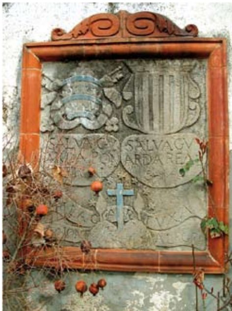
Figura 8. Placa situada a la casa propera al molí de Lloberons que recorda la pertinença de la zona a la Cartoixa de Montalegre