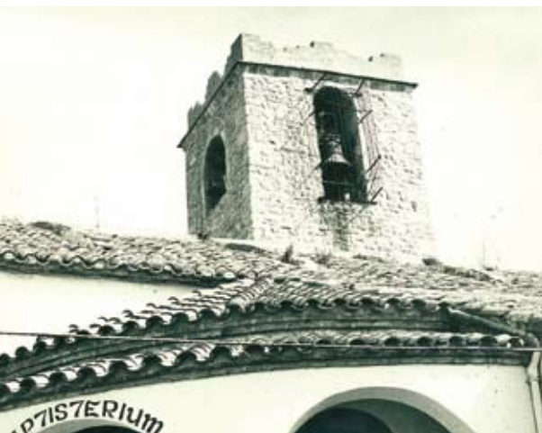
Figura 16. Detall

A l'Arxiu Diocesà, on es guarden els qüestionaris de les visites pastorals, en el volum 46, foli 36, es troba el qüestionari de la visita pastoral a l'església