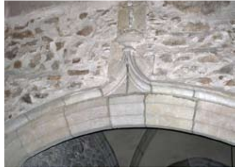
Figura 9. Arc flamíger

EL COR no fa pas gaire anys que encara es podia veure. Es tractava d'una estructura molt senzilla de fusta, amb un entarimat que descansava entre el mur de la façana i una biga de fusta. Es calcula que fou construït entre els segles XVI i XVII.