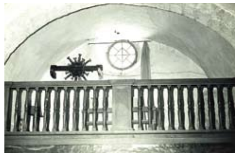
Figura 11. El cor avui desaparegut