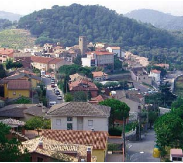
Figura 2. Situació de l'església

plaça del Lledoner, un arbre més que centenari.