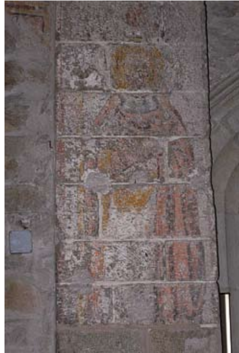
Figura 10. Pintura mural