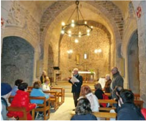
Figura 7. Vista general interior