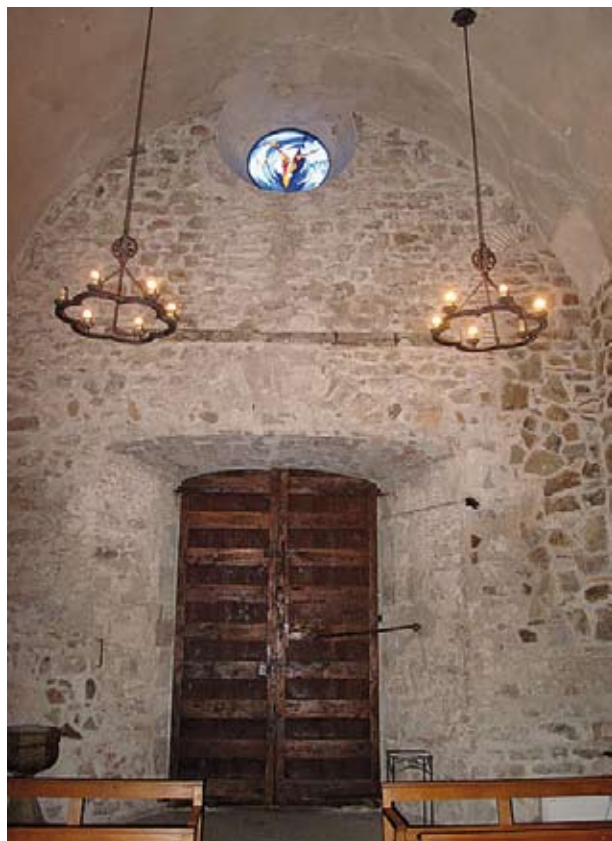
Figura 14. Interior de la façana principal