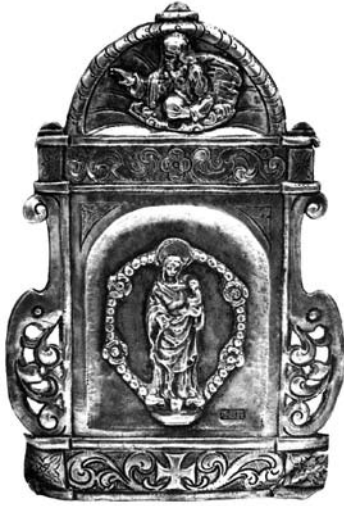
Figura 22. Portapeu de plata d'estil barroc amb la Verge del Roser

un qüestionari de la visita pastoral de l'any 1942, on s'indica que la parròquia abraçava dos municipis i que la regia mossèn Salvador Balletbò Duran, prevere, ecònom de Sant Fost de Campsentelles, de 46 anys i natural de Sant Boi de Llobregat.