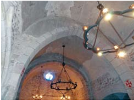
Figura 8. Els diferents arcs

LES CAPELLES LATERALS. Als voltants del segle XV es va ampliar l'església amb les capelles que es descriuen a continuació.