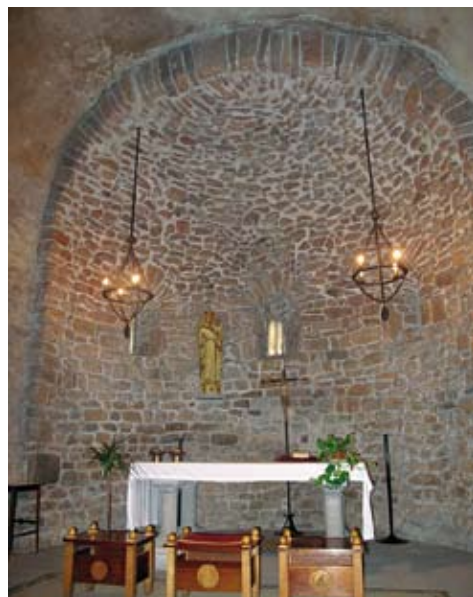
Figura 5. Exterior de l'absis