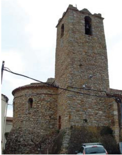
Figura 15. Torre del campanar