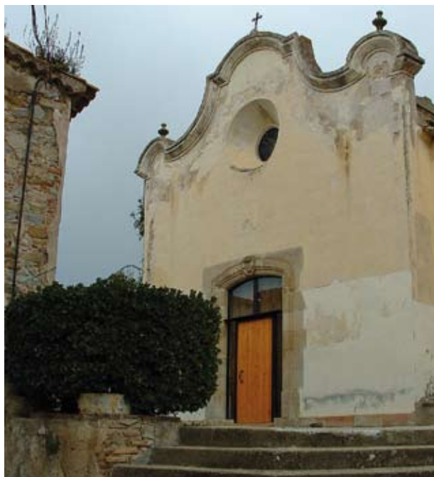
Figura 13. Façana principal