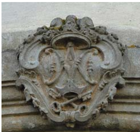
Figura 12. Escut

LA FAÇANA PRINCIPAL d'estil neo-clàssic, del segle XVIII, està rematada en la seva entrada per un arc de pedra calcària, mineral que no es troba en els nostres municipis. L'escut que remata l'arc representa l'anagrama de l'Assumpció de Maria i les claus de Sant Pere. Des de la part interior de la façana es poden observar les marques d'un antic accés a la rectoria que es comunicava amb l'església per mitjà d'un pas elevat.