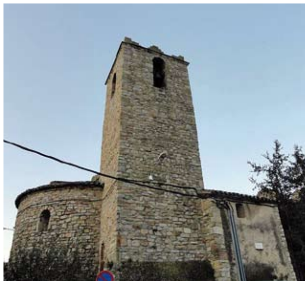
Figura 1. Vista de l'església en el seu estat actual